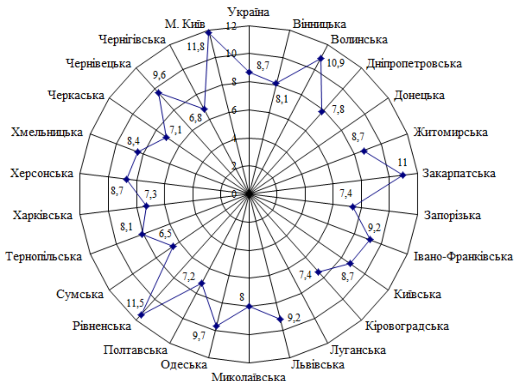
Рис. 1. Регіональні відмінності показника загального коефіцієнта народжуваності в Україні, 2018 р. (розроблено за даними [1, с. 104]) 1

До найважливіших індикаторів стану соціальної безпеки в контексті сталого розвитку належать демографічні показники природного руху населення, передусім народжуваності й смертності. Україна серед сусідніх держав виділяється низькими показниками першої та високими – другої, тобто значним перевищенням смертності над народжуваністю. Щоправда, наприклад, для Волинської, Закарпатської, Рівненської областей і столиці України характерна позитивна тенденція, тобто коефіцієнт смертності є дещо нижчим (рис. 1).